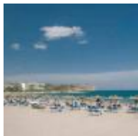
El Arenal [14]