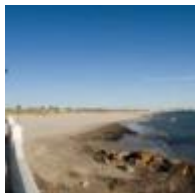
El Mojón [18]

En l'extrem més meridional de la Comunitat Valenciana, és una platja oberta d'arena