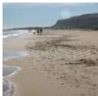
El Carabassí [16]