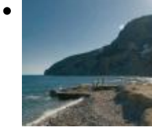
Les Urques [7]

Cala rústica de grava i birles ubicades en l'extrem sud de la gran cala que forma el Penyal d'Ifach pel nord i el Morro de Toix pel sud.