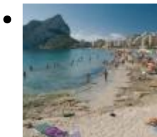
Levante o La Fossa [9]