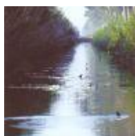
El Parc Natural de les llacunes de la Mata i Torreveija [5]