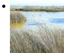
El Parc Natural de Cabanes i Torreblanca [1]