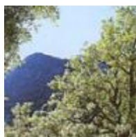
El Parc Natural de la Serra d'Espadà [4]