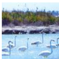
El Parc Natural de les salines de Santa Pola [6]