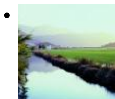
El Parc Natural de l'Albufera [2]