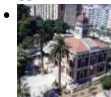
Palacete i Jardins d'Ayora [3]