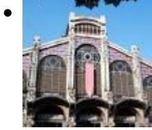
Mercat Central [10]