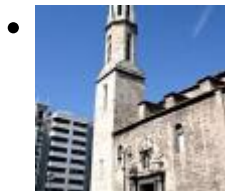
Església Parroquial De Santa Caterina I Sant Agustí [1]