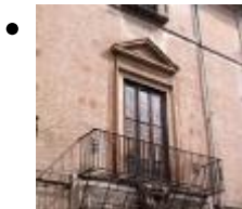
Palau dels Catalá de Valeriola [11]

La fatxada principal, d'estil neoclàssic, es presenta caracteritzada pels balcons de ferro. El pati és de planta quadrada i en l'interior de l'edifici sobreïx una volta.