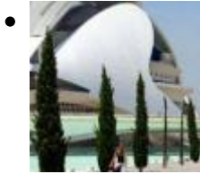
Palau de Les Arts Reina Sofía [7]