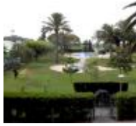
Devesa Gardens [4]