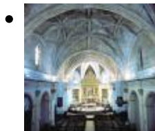
Església Parroquial de Santa Maria [1]