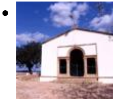
Ermita de Sant Joan [8]

En un paratge d'excepció, la blanca ermita de Sant Joan forma part d'una de les anomenades "ermites de la conquesta", que es van construir després de la reconquesta cristiana del terme.