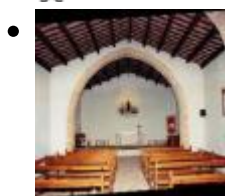
Ermita de Santa Paula [3]

L'ermita de Santa Paula és una de les ermites de la Conquesta i acull una romeria que se celebra el 26 de gener, data en què el temple obri les seues portes.