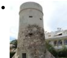
Torre Almadrava [6]

Esta torre formava part de la xàrcia de vigilància i defensa de la població davant de possibles atacs de pirateria. És una torre sentinella de maçoneria i cos troncocònic que ha sigut restaurada recentment.