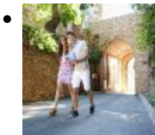
Barri Les Roques [9]

Barri del S. XIX. en esta zona es trobava l'antiga mitja àrab (cases del poble àrab).