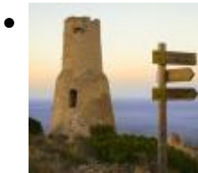
Torre del Gerro [5]

La seua posició privilegiada permetia el control de quasi tot el Golf de València. La seua peculiaritat consistix en la divisió que presenta el seu cos central i posseïx un escut d'armes.