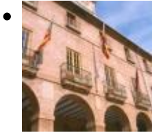
Ajuntament de Dénia [7]

Quan es va deixar d'utilitzar la torre del Consell, les autoritats se traslladaren a l'actual ajuntament, d'estil gòtic, a què se li va afegir una fatxada barroca.