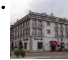
Magatzems Portuaris (Antigues Drassanes) [4]

L'edifici es troba actualment descatalogat, ja que el desenrotllament i el comerç només ha mantingut d'aquella nau de construcció de barcos el seu aspecte exterior, que presenta una sostrada de teula àrab.