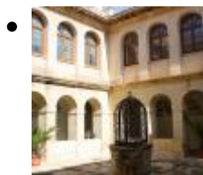
Església se l'exconvent de Sant Josep [1]

L'antic Convent de Sant Josep de frares franciscans va passar a ser, en el XVIII, hospital. Actualment alberga la biblioteca i l'arxiu municipal, restaurats. Destaca l'Església barroca i el claustre.