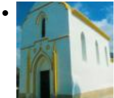
Ermita del Santíssim Crist del Remei [12]

L'ermita es va alçar sobre un antic castell àrab panoràmiques i des del seu enclavament s'oferix una completa vista de la comarca, des de les muntanyes de l'interior fins al litoral.