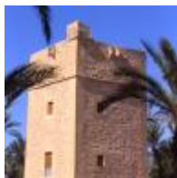
Torre Dels Vaillos [7]

La torre es troba en l'interior del conjunt patrimonial. Actualment presenta quatre plantes.