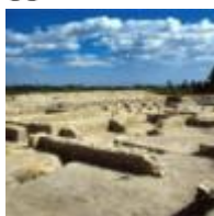
L'Alcudia Parc Arqueològic i Museu [9]