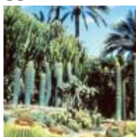
Hort del Cura (inclòs en el Conjunt del Palmerar, Patrimoni de la Humanitat) [8]

Amb més de 13.000 metres quadrats de plantes tropicals i mediterrànies, este jardí exòtic va ser declarat Jardí Artístic Nacional en 1943. A més, exhibix l'únic exemplar de palmera datilera amb set fills, coneguda com la Palmera Imperial.