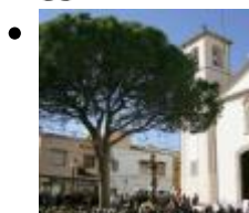
Església Parroquial [10]

En els seus orígens, el temple es va dedicar a Sant Josep, primer patró del poble, però actualment està dedicada al Crist del Bon Encert, una talla que es va alliberar de la crema del convent de València on es trobava i donada als alfassins.