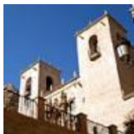
Basilica de Santa María [13]