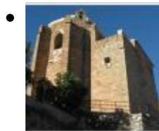
Ermita de Sant Roc [6]