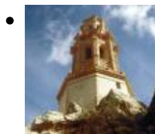
Torre Mudèjar de les Campanes o l'Alcúdia [7]