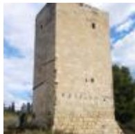
Torre El Xiprer [11]

Es troba al sud de Benimagrell i és una torre exempta que presenta diverses finestres i tres plantes. A més, en el seu interior es conserva part de la seua estructura original. Es troba en una propietat privada.