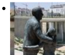
Conjunto escultórico de Carmen Fraile [3]

Dins del parc central del Campello, molt pròxim a la Font del Centenari, hi ha el conjunt escultòric de Carmen Fraile.