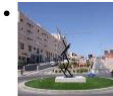
Homenaje a El Campello [1]