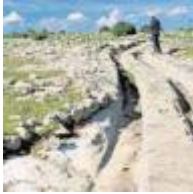
De Requena a Ayora [14]