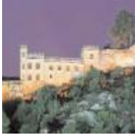
De Buñol a Xàtiva [12]