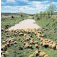
De Barracas a Sagunt [10]