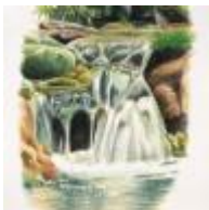
El Alto Palancia [14]