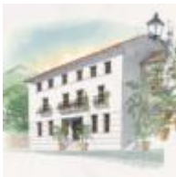
La Tinença de Benifassà [12]