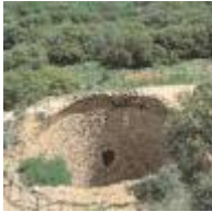
De Alcoi a Alacant [10]