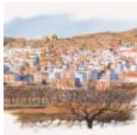
Rincón de Ademuz [2]